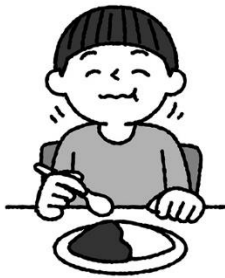
よく噛んで食べる 唾液は歯のガードマン