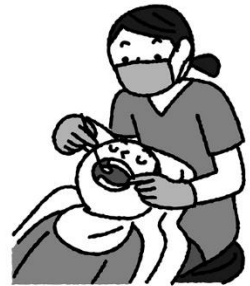
定期的に歯科医院で 歯の健康チェック！