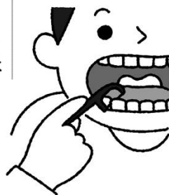
歯間ブラシやフロスも使って 歯と歯の間もきれいに