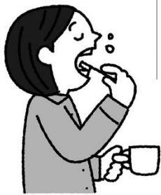
寝ている間に増える歯垢 寝る前の歯みがきが大事